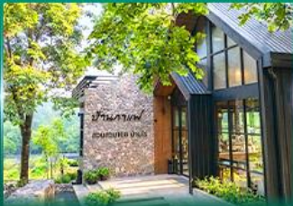
ร้านค้าพ สนวนสวย 168