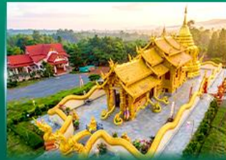
วัดเทพนิมิตประดิษฐ์