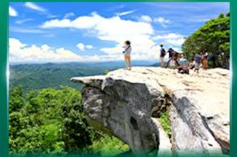
จุดชมวิวดาสุดาแผ่นดิน