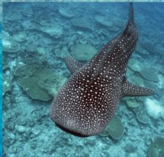
Whale Shark Snorkeling