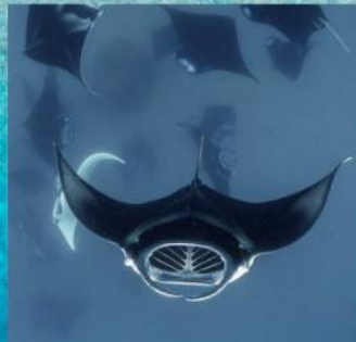
Manta Ray Snorkeling