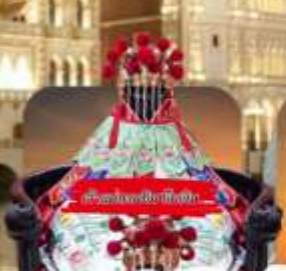
วัดของวัดอึ้งจุก