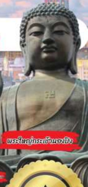
พระใหญ่กระเขนของยง