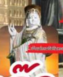
วัดของวัดอึ้งจุก