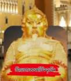
วัดของวัดอึ้งจุก