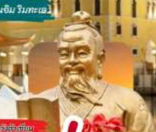
วัดของงกก