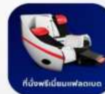
ที่นั่งพรีเอ็มเชนเฟลตเบด