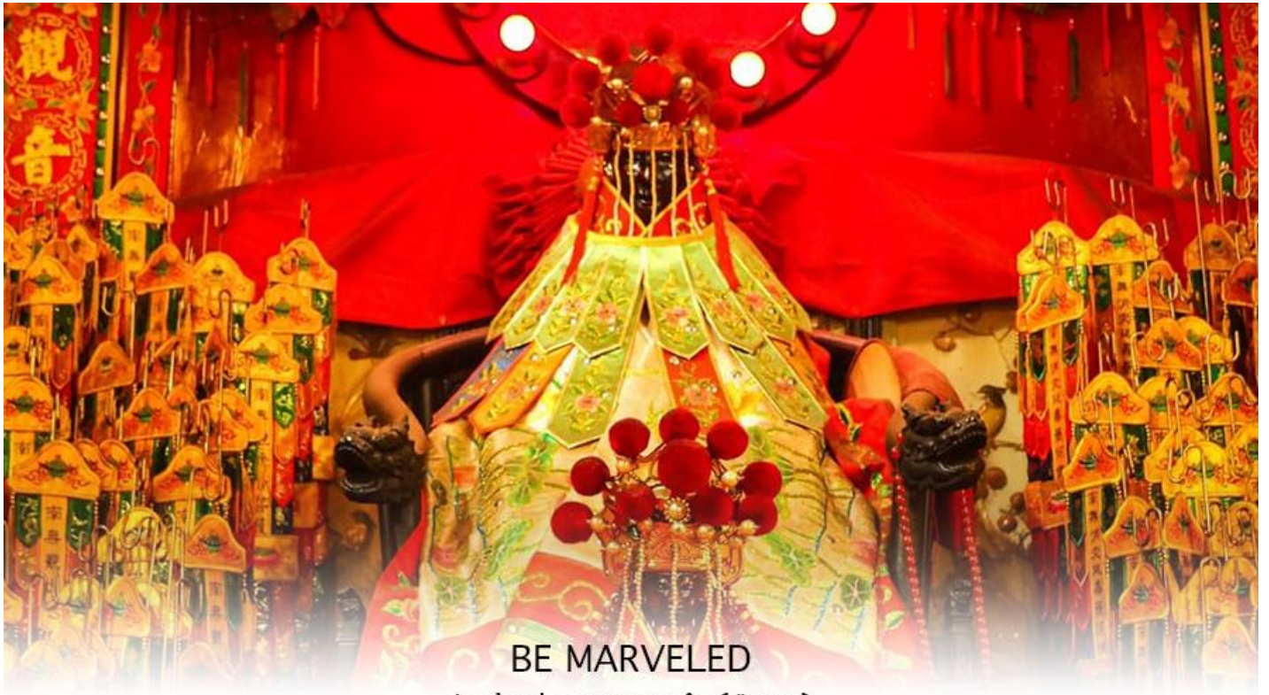
BE MARVELED วัดเจ้าแม่กวนอิมฮองอ่า (ยิมวิน)

ที่จัดขึ้นในทุกๆปี พิธีนี้จะมีเพียงครั้งปีละครั้งเท่านั้น เป็นวันสำคัญอีกวันที่คนหลังไหลมาไหว้ขอพรอย่างไม่ขาด สาย