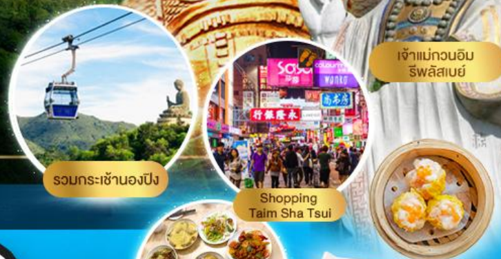
รวมกระเช้าฮ่องกง