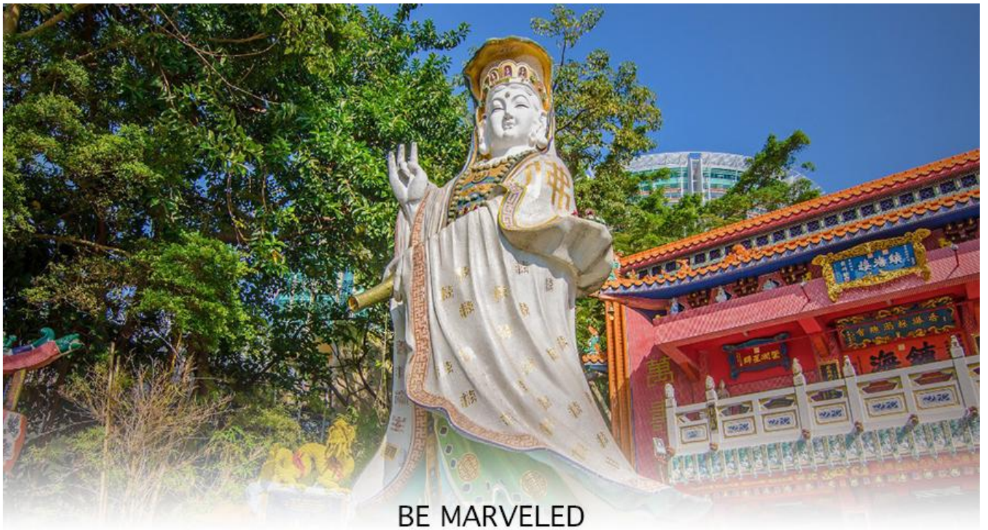
BE MARVELED วัดเจ้าแม่กวนอิมรัพลัสเบย์

ตั้งอยู่ ซึ่งคนฮ่องกงและคนจีนให้ความเคารพนับถือมากที่สุด เชื่อว่าเป็นเทพที่มีความศักดิ์มากขอพรเรื่องการเงิน การเงิน และขอพรขอ โชคลาภเพื่อเป็นสิริมงคลและขอพร เจ้าแม่ทับทิม หรือ เทพธิดาแห่งท้องทะเล ซึ่งทำหน้าที่ปกป้องคุ้มครองชาวประมง ตั้งโดดเด่นอยู่ท่ามกลางสวนสวยที่ทอดยาวลงสู่ชายหาดให้ท่านนมัสการขอ และนำท่านเดินข้าม สะพานต่ออายุ ซึ่งเชื่อกันว่าข้ามหนึ่งครั้งจะมีอายุเพิ่มขึ้น 3 ถ้าข้ามแล้วห้ามเดินย้อนกลับไปเด็ดขาด เพราะคนฮ่องกงเชื่อว่าชีวิตจะสั้นลงไป 3 ปี สำหรับคนโสดจะนิยมขอพรกับ เทพเจ้าแห่งความรัก ให้เอามือลูบที่บริเวณหินสีดำ พร้อมกับอธิษฐานให้สมหวังกับความรัก ปิดท้ายด้วยการรับพลังฮวงจุ้ยจาก ศาลา แผลทิต ซึ่งถือเป็นจุดรวมรับพลัง ถือเป็นจุดที่มีฮวงจุ้ยดีที่สุดของเกาะฮ่องกง และยังมีรูปปั้นองค์เทพอีกมากมายภายในวัดแห่งนี้ ให้กราบไหว้ขอพร