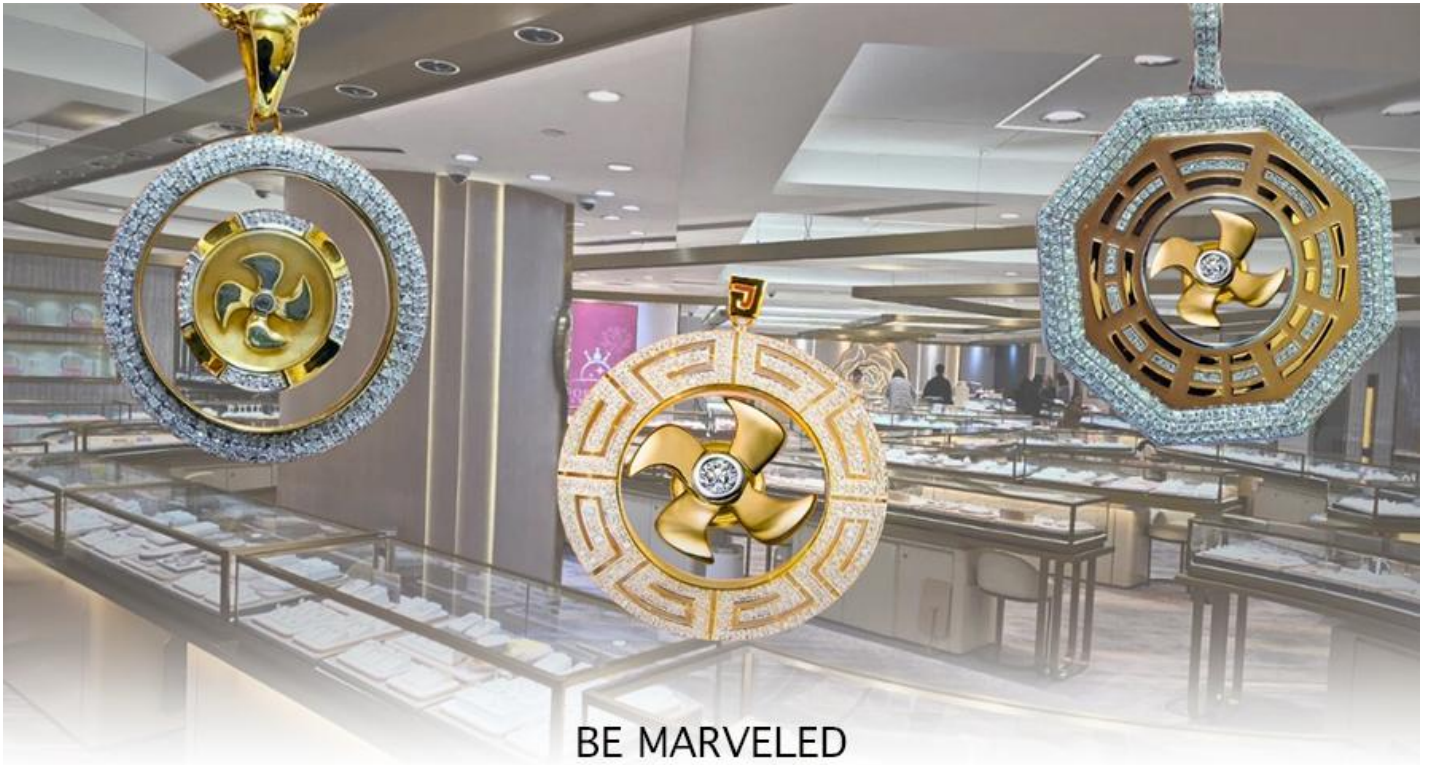
BE MARVELED ศูนย์ฮวงจุ้ย กังหันเศรษฐี

และนำท่าน ชม ศูนย์ปีเซี่ยะ ซึ่งคนจีนนั้น ถือว่าหยกเป็นหิน ที่เป็นตัวแทนของความสวยงามและความบริสุทธิ์ มีความเชื่อว่าหยก มงคล ถ้าพกติดตัวไว้จะอายุยืนและสุขภาพดีมีสินค้ามากมายเกี่ยวกับหยก อาทิ กำไลหยก หรือ สัตว์นำโชคอย่างปีเซี่ยะ ให้ท่าน ได้เลือกซื้อเป็นของฝาก, ของที่ระลึก หรือของนำโชคแต่ตัวท่านเอง