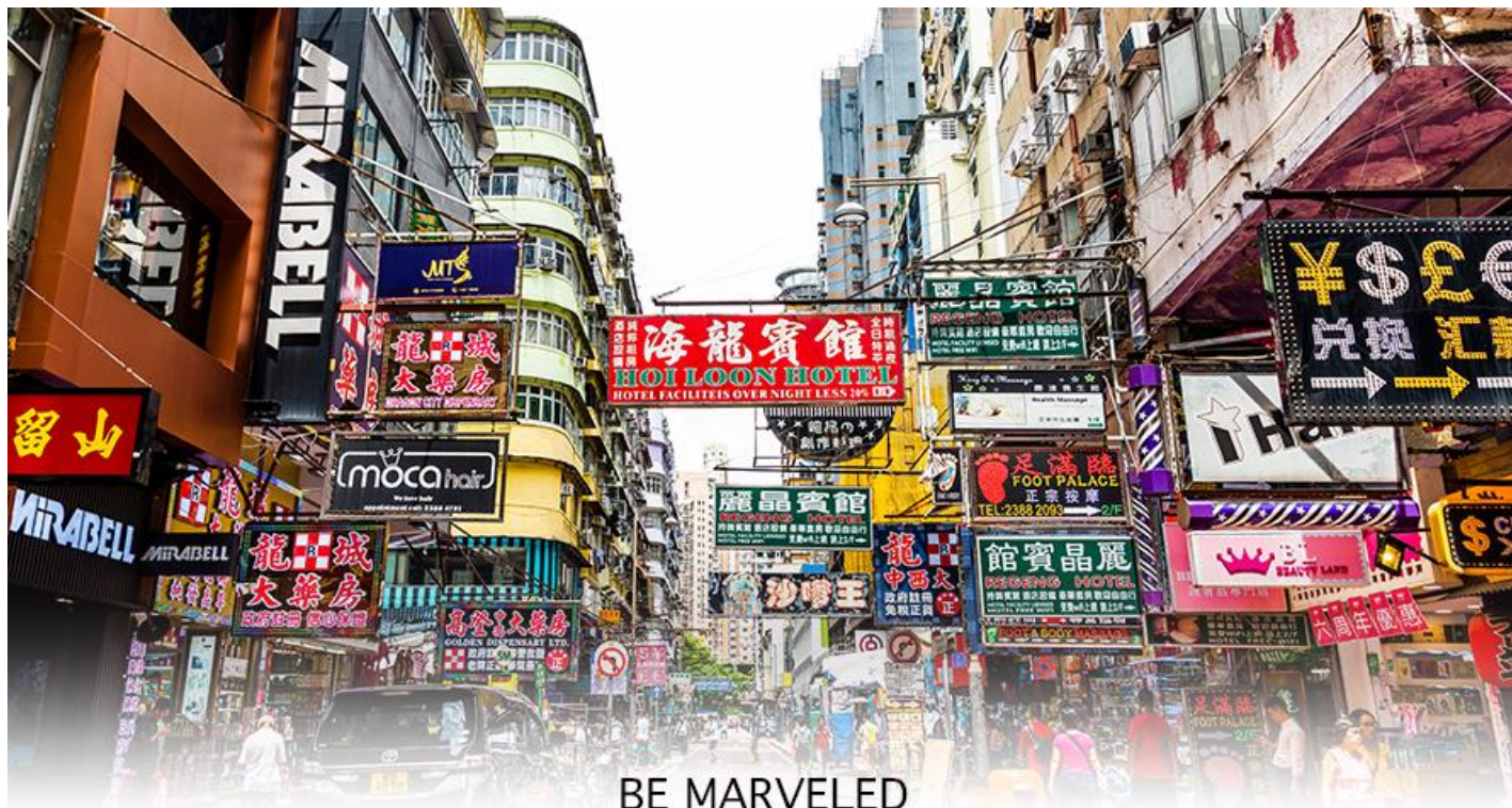
BE MARVELED MONGKOK

เครื่องประดับมากมาย อีกทั้งยังมีร้านอาหารและเครื่องคืม ที่ขึ้นชื่อหลากหลายชนิด ให้ทุกท่านได้ลองลิ้มรสอีก มากมาย