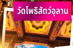
วัดโพธิ์สัตว์อูลาน