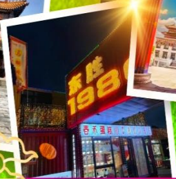
ถนนคนเดินคังบาร์ซี