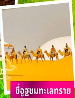
ขี่อูฐชมทะเลทราย