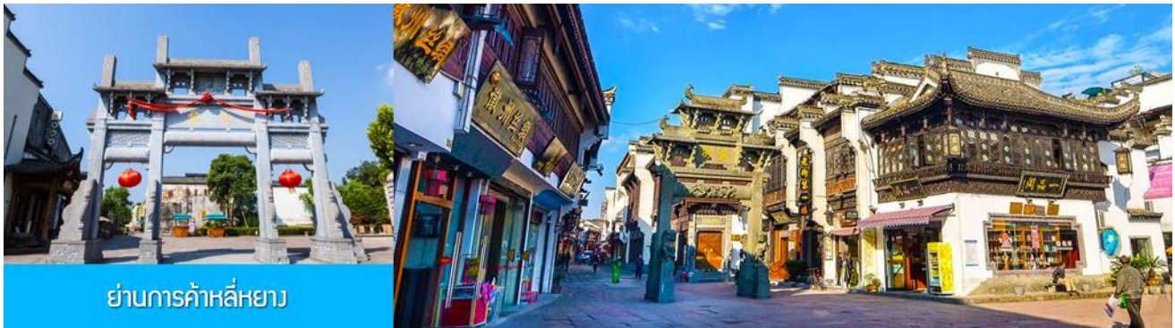
ย่านการค้าหลี่หยาง

เที่ยง อีระอาหารมื้อกลางวัน ( ท่านสามารถเลือกชิมอาหารพื้นเมืองในระแวกโรงแรมได้ตามอัธยาศัย )