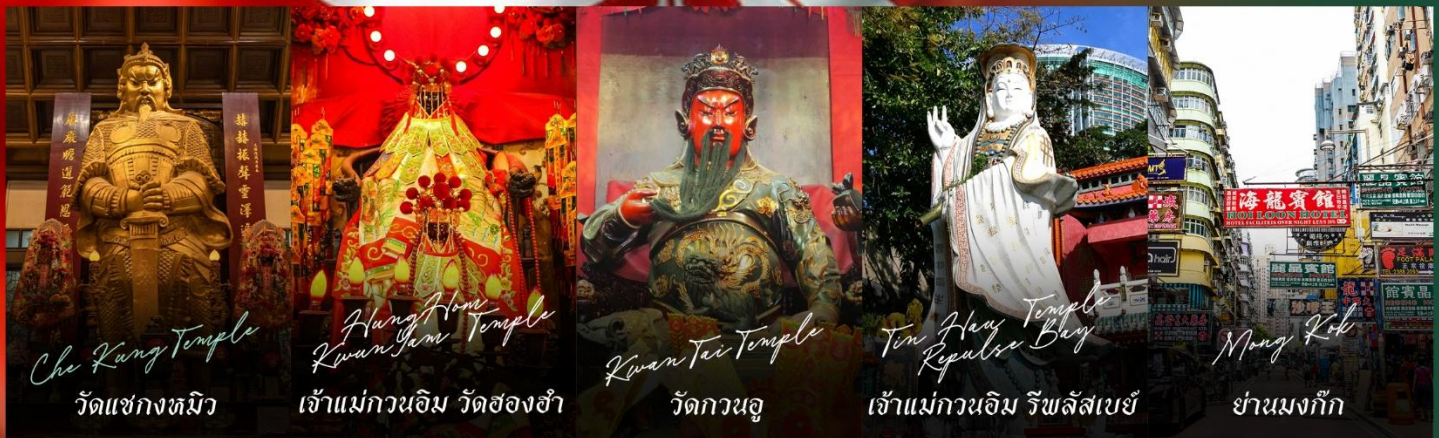
Che Kung Temple วัดแชกงงม๊ิว

รายการทัวร์ข้างต้นอาจมีการปรับเปลี่ยนเพื่อความเหมาะสม