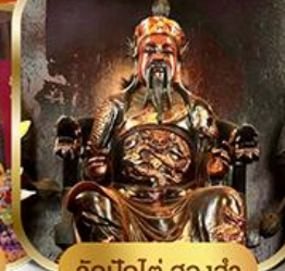
วัดบิกไต้ ฮองอ่า