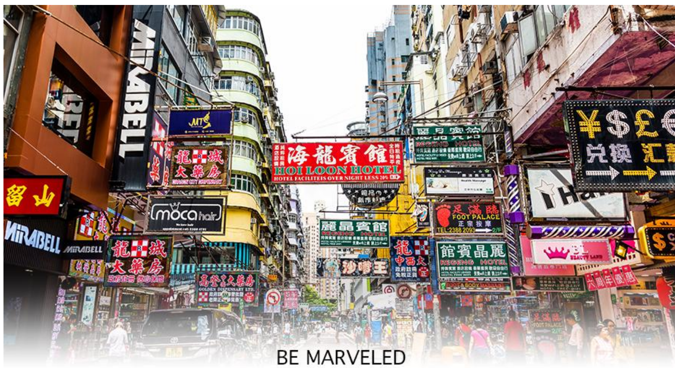
BE MARVELED MONGKOK

ช้อปปิ้ง ย่านมงก๊ก (Shopping Mongkok) เป็นแหล่งช้อปปิ้งที่เต็มไปด้วยตรอกซอกซอยที่มีเอกลักษณ์แปลกตา รวมทั้งตลาดเก่าแก่ที่สะท้อนเสน่ห์ และวิถีชีวิตของคนท้องถิ่น ถือเป็นหนึ่งในย่านยอดนิยมที่นักท่องเที่ยวทุกคนต้องแวะเวียนมา มีร้านสวยๆ บาร์เท่ๆ หลบซ่อนตัวอยู่มากมาย ภายในย่านมีตลาดนัด LADIES' MARKET ขนาดใหญ่ซึ่งมีร้านขายเสื้อผ้า เครื่องสำอาง รองเท้า กระเป๋า เครื่องประดับมากมาย อีกทั้งยังมีร้านอาหารและเครื่องดื่ม ที่ขึ้นชื่อหลากหลายชนิด ให้ทุกท่านได้ลองลิ้มรสอีกมากมาย