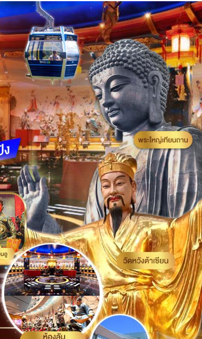
พระใหญ่เทียนถาน