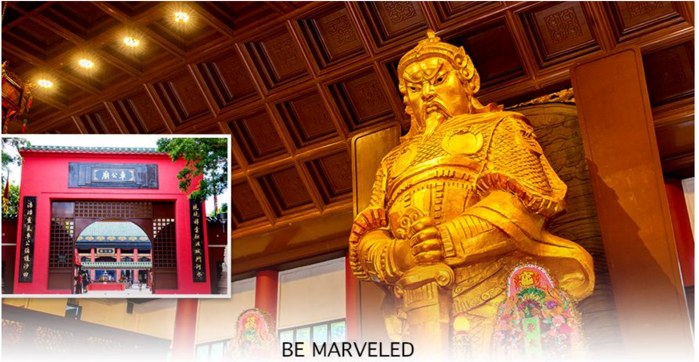
BE MARVELED วัดแขก