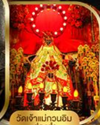
วัดเจ้าแม่กวนอิม ฮองอ่า