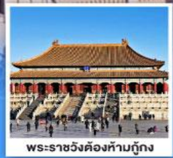
พระราชวังต้องห้ามปักกิ่ง