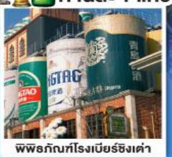
พิพิธภัณฑ์โรงเบียร์ชิงเต่า