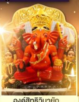
องค์สิทธีวินายก