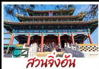
สวนจิ่งอัน