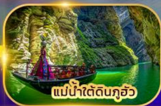
แม่น้ำใต้ดินกุ้ยโจว