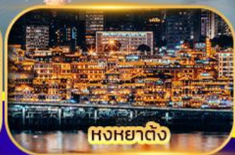
หงหยาดิง