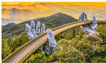
บานาฮิลล์