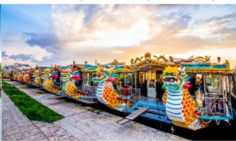
ล่องเรือมังกร