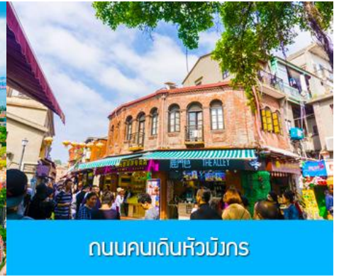
ถนนคนเดินหัวมังกร