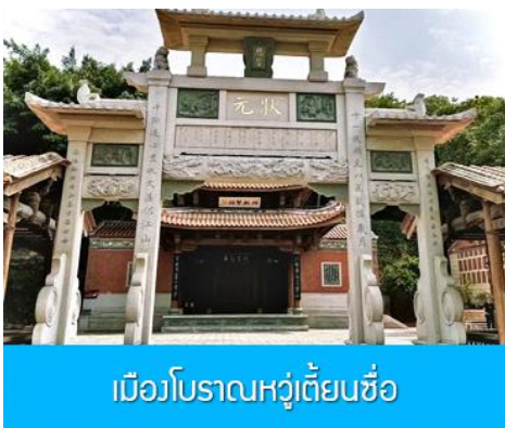
เมืองโบราณหวู่เตี้ยนซื่อ

พักที่ โรงแรม XIAMEN HENGLONG HOTEL 4* หรือเทียบเท่าในเมืองเซี่ยเหมิน