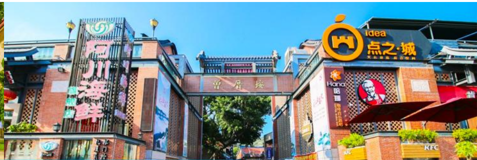
หมู่บ้านชาวประมง เจิงจ้าวอัน