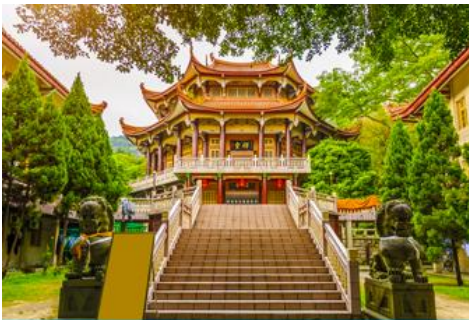
วัดหนานถ้าวชื่อ

ค่ำ รับประทานอาหารค่ำ ณ ภัตตาคาร (1) พักที่ โรงแรม XIAMEN HENGLONG HOTEL 4* หรือเทียบเท่าในเมืองเซี่ยเหมิน