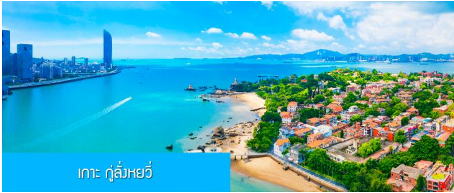
เกาะ กู่ล้งหยวี