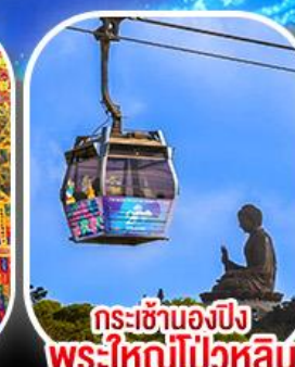
กระเช้าองปีง พระใหญ่โป่วหลิน