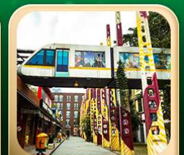
“ดงเจียวจื่อ”