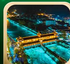
“สะพานหนานเฉียว น้ำคาสีฟ้า”