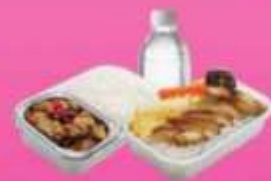
บริการอาหารร้อนบนเครื่อง ซาโป - ซากสึบ