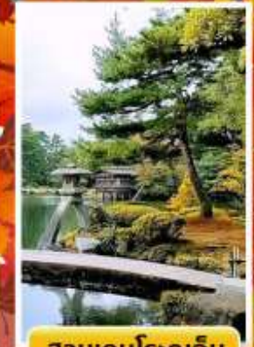
สวนเคนโระคุเอ็ง