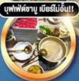
บุฟเฟ่ต์จามู มีออร์โบน!!