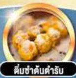
ติ่มซำคันทาร์รับ

เดินทาง พ.ค. 69 | 16-18, 23-25 มี.ย. 69 | 1-3