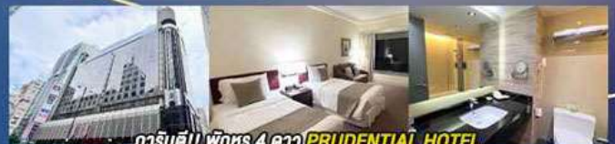
การันตี!! พักหรู 4 ดาว PRUDENTIAL HOTEL ติดถนนนาธาน ย่านช้อปปิ้งจิมซาจู้