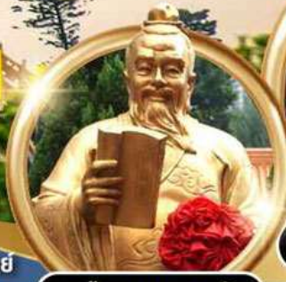
ผูกค้ายแดงขอความรัก