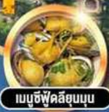
เบบู้ชี่ฟู้ดลีสุมมูน