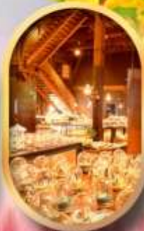
พพิธกันที่กลองดนตรี