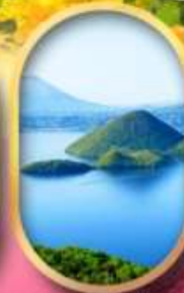
วิวทะเลสาบโทยะ