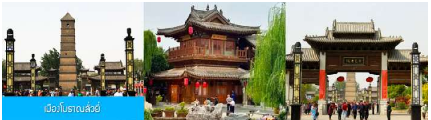
เมืองโบราณฉว่หยี่

16.18 น. ขบวนรถไฟนำคณะเดินทางถึงสถานีรถไฟนครฉว่หยาง นำคณะขึ้นรถบัสเพื่อเดินทางสู่ นครฉว่หยาง