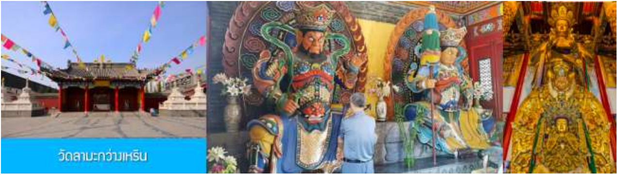
วัดลามะกว่างเหริน