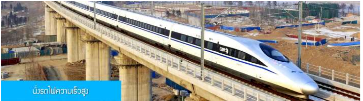
เมืองรถไฟความเร็วสูง

หลังอาหารนำท่านเดินทางสู่สถานีรถไฟความเร็วสูงนครซีอาน เพื่อเตรียมเดินทางสู่นครฉว่หยาง