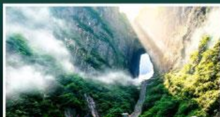
เขาประตูสวรรค์