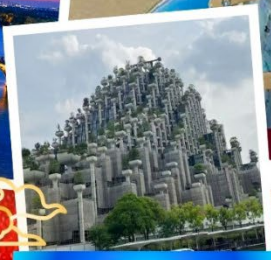
Tian An 1000 Trees