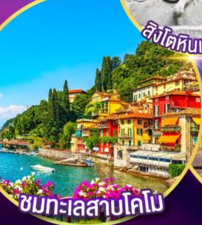
ชมทะเลสาบโคโม