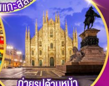
ถ่ายรูปด้านหน้า "มหาวิหารมิลาน"