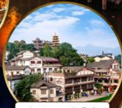
เมืองโบราณฉือจี้โฮ่ว