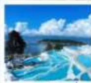
ซานโตรีนิต้าหลี่