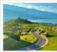
ภูเขาอวี่นเซียงชาน