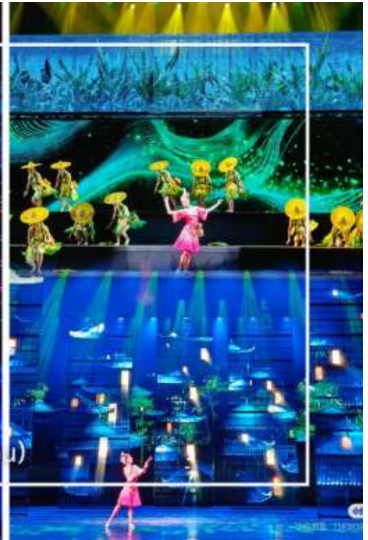
การแสดงโชว์ซีลิ่งคาปู (Xilan Kapu)

เดินทางเข้าโรงแรมที่พัก Xiazhou Hotel ระดับ 4 ดาวหรือเทียบเท่า