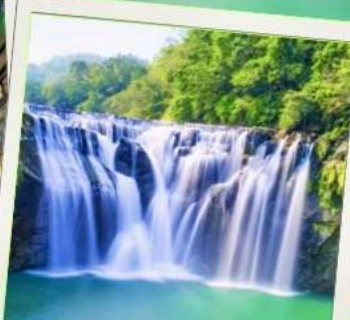
น้ำตกสี้อเฟิ่น