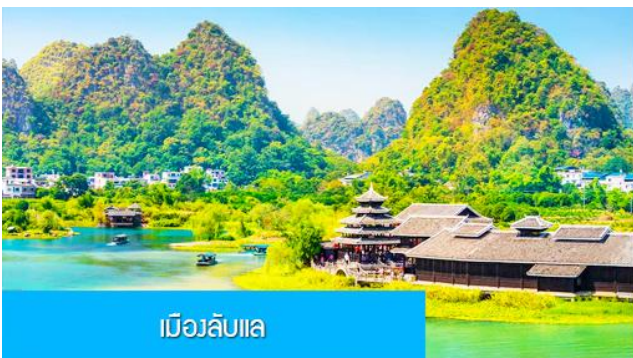
เมืองลับแล

พักที่ YANGSHUO ELITE GARDEN HOTEL ระดับ 4 ดาว ท้องถิ่นหรือเทียบเท่าใน เมืองหยางซั่ว