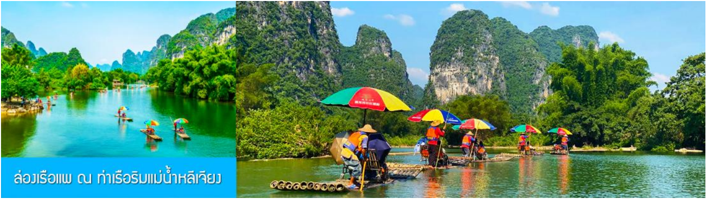
ล่องเรือแพ ณ ท่าเรือริมแม่น้ำหลีเจียง