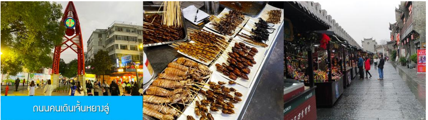
ถนนคนเดินเจิ้นหยางลู่