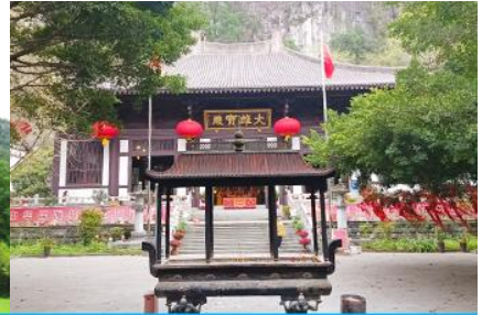
วัดซีเสี่ย