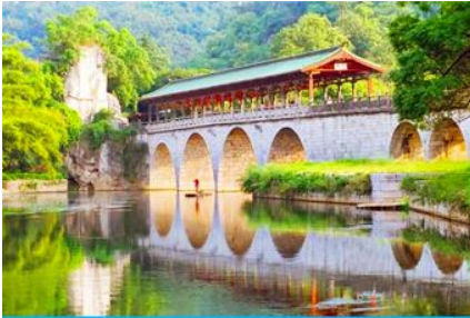
สวนเจ็ดดาว

หลังอาหารเช้าท่านเดินทางสู่ เมืองกุ้ยหลิน 桂林 เมืองท่องเที่ยวชื่อดังในมณฑลกวางสี