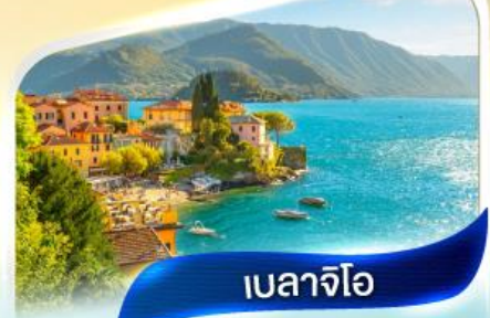
เบลลาจีโอ