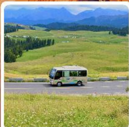
ทุ่งหญ้าเจียนปูลาเค่อ