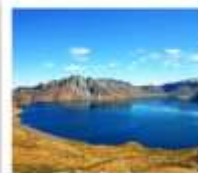
ฉางไป่ซาน