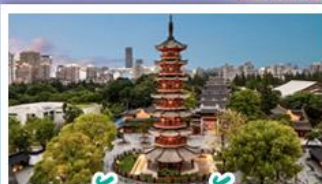
วัดเลงเซ้ง