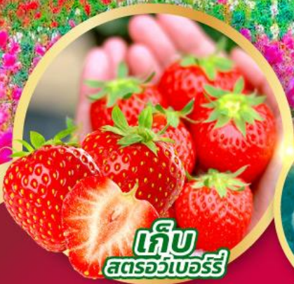
เก็บ สตอร์วเบอร์รี่