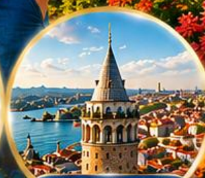
หอคอยกาลาตา Galata Tower