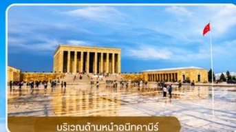
บริเวณด้านหน้าอนิคาบิร์