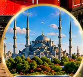
สุเหร่าสีน้ำเงิน Blue Mosque