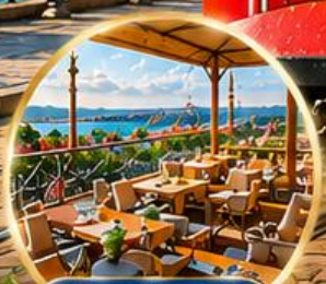
Seven Hills Cafe ชมวิว อิสตันบูล