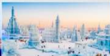
เทศกาลคอมไฟน้ำแข็ง