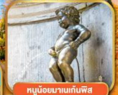
ทูน้อยมานเทินพีส