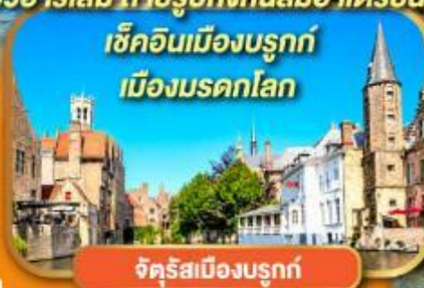
จัตุรัสเมืองบรูคก์