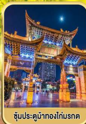
ซุ้มประตูม้าทองไถ่มรดก