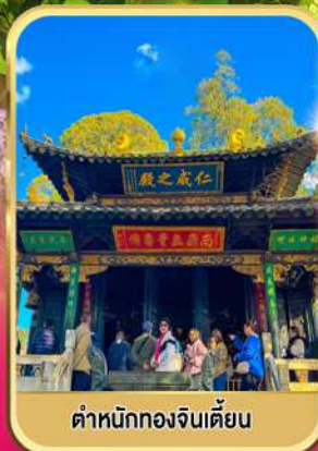
ตำหนักทองจินเตียน