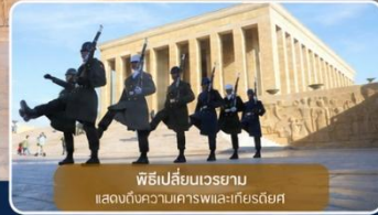
พิธีเปลี่ยนเวรยาม แสดงต้นตอความเคารพและเกียรติยศ

ได้เวลาเดินทางทางสู่เมือง "ซาฟรานโบลู" (Safranbolu) คือเมืองท่องเที่ยวที่มีชื่อเสียงของจังหวัดการาบึค (Karabük) ในภูมิภาคทะเลดำตุรกี เป็นเมืองที่มีความสำคัญทางด้านประวัติศาสตร์ของประเทศ ตุรกี โดยเฉพาะชื่อเสียงเกี่ยวกับสถาปัตยกรรมซาฟรานโบลู ที่มีอิทธิพลต่อพัฒนาการชุมชนเมืองทั่วทั้งจักรวรรดิออตโตมัน ต่อมาในปี 1994 เมืองซาฟรานโบลู ได้ถูกองค์การยูเนสโกยกให้เป็นมรดกโลกทางด้านวัฒนธรรม