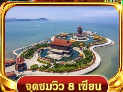
จุดชมวิวกว 8 เซียน