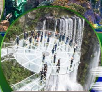
สะพานแก้วคู่หลงเซี่ยะ