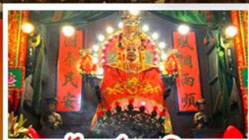
วัดเซกตงเหมียว