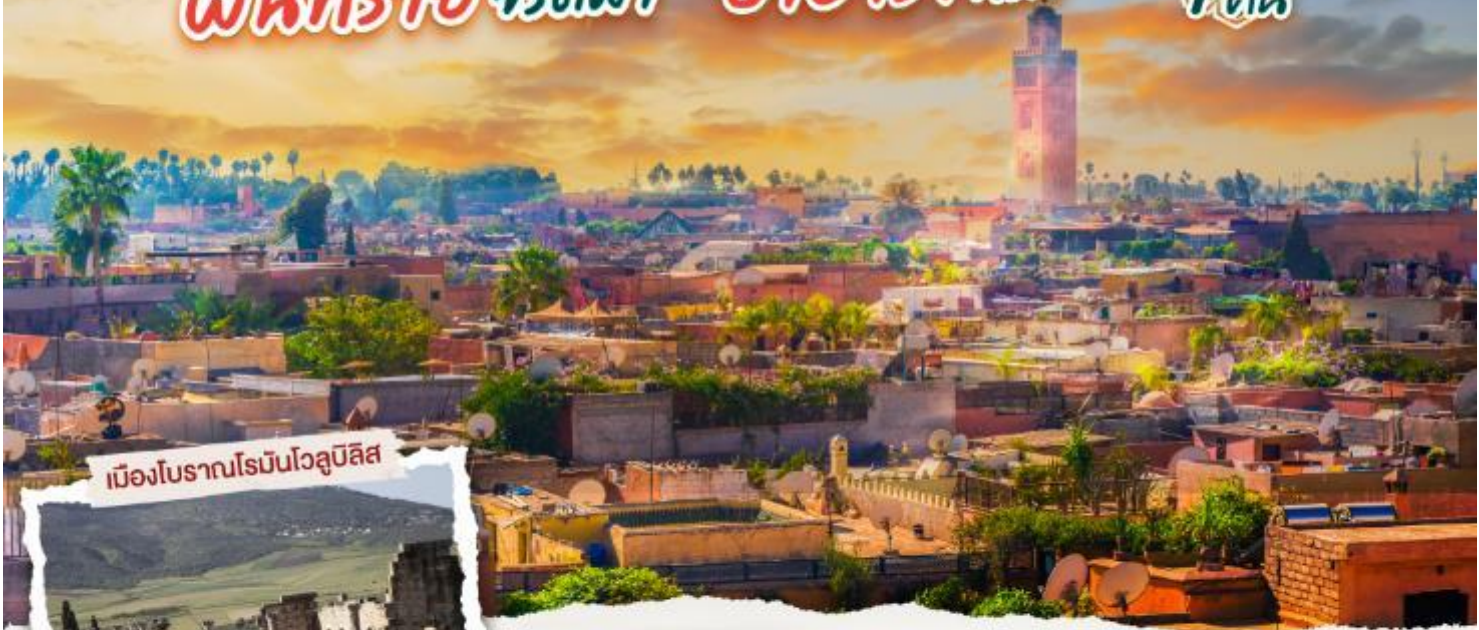
เมืองโบราณโรมันโวลูบิลิส