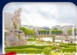
สวนมิราเบิล ซาลซ์บูร์ก