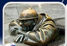
ประติมากรรม Cumil

มาเรียนพลาซซ์ • บ้านเกิดโมสาร์ท • พระราชวังฮอฟบวร์ก • ซาลส์บวร์ก • บ้านเกิดโมสาร์ท • เกรโกเดร์สตรีก • ทะเลสาบคอนิกซ์ • หมู่บ้านอัลล์สตัดท์ • อนุสาวรีย์มาเรียเทเรซา