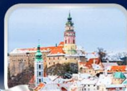
เมืองเชสกี กลุมลอฟ