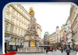
ซ็อบบิงการ์ทเนอร์สตรีก