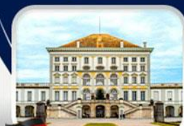
พระราชวังนิมเฟนบูร์ก